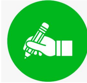
Photo de l'équipe (à prévoir/ à envoyer)

Instagram de l'équipe et/ou Facebook:.....